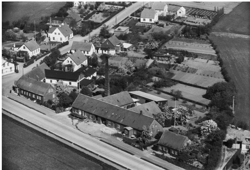
Lufffoto 1949. Bygaden med Forsamlingshuset og Brugsen på hjørnerne og bageriet til venstre lidt nede af gaden